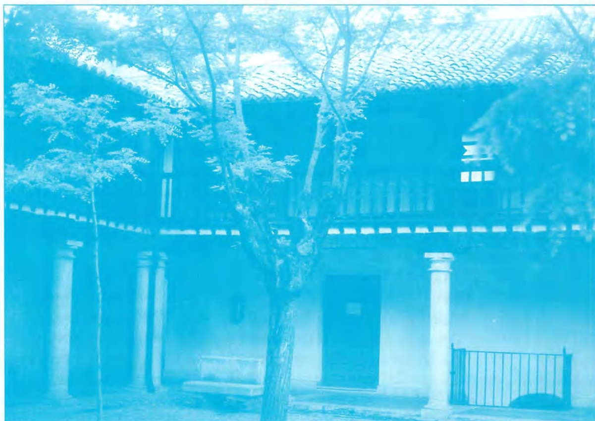
Patio del “Hospitalillo de San José” (Getafe).

El desarrollo del Getafe de los Austrias se va a ver truncado por la Guerra de Sucesión, acompañada de malas cosechas, y una fuerte presión fiscal, que hará que el siglo XVIII el pueblo pierda la mitad de sus habitantes, como veremos en el siguiente capítulo.