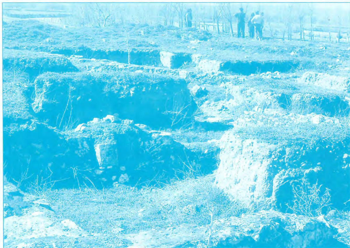
Villa Romana de la Torrecilla (Perales del Río).

En el Barrio de San Isidro, en la acera meridional de la c/ Sur (ahora c/ Greco) se encontró el día 18 de Mayo de 1981 un importante yacimiento cuando se construía un paso subterráneo para el ferrocarril, procediéndose a una excavación de urgencia que empezó dos días después. Se encontraron importantes piezas cerámicas realizadas a torno, que debieron utilizarse para contener vino, diversas monedas de bronce, con inscripciones (no olvidemos que los romanos ya utilizaban la moneda como patrón de cambio), recipientes de bronce como cuencos, pateras, acetres, e instrumentos de Hierro, como picos, hachas, azadas, podaderas, destacando una gran parrilla, unas llaves y un cencerro, todo ello de época tardorromana y que no parece responder a un asentamiento estable.